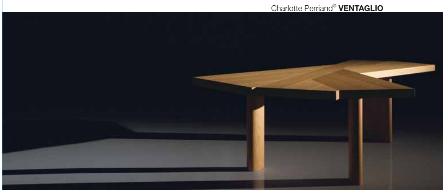
Charlotte Perriand® VENTAGLIO